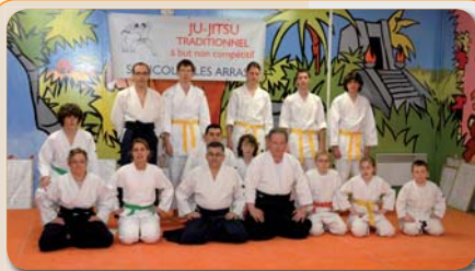
Saint Nicolas Arts Martiaux Cérémonie des vœux

Visite des Carrières de Wellington par l'association Médéo fêtes Renseignements et réservations 06 72 71 93 91