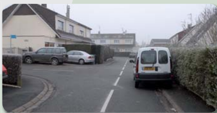
Avec ce stationnement gênant : attention danger ! ▲