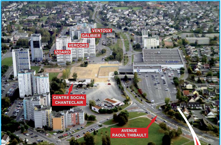
Plan du quartier existant ▲