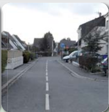
Sans stationnements sur les trottoirs, la circulation est plus fluide. ▲