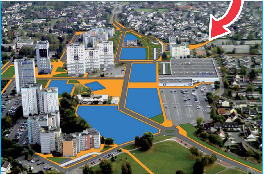
Plan du quartier rénové ▲