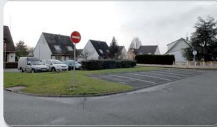
Places de parking vides qui ne demandent qu'à être utilisées. ▲

► Une réflexion par les services techniques de la ville est engagée pour trouver des solutions à ces problèmes récurrents. Les décisions ne se feront pas sans vous.