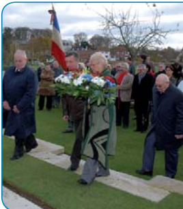
Commemoration Armistice du 11 novembre