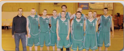
Basket Club de Saint Nicolas

Du 4 au 28 novembre dernier, les membres du club photo Capture ont exposé une série de photographies sur la ville de Paris dans les couloirs du Centre social Chanteclair. 38 clichés en noir et blanc illustrant la vie de la capitale.