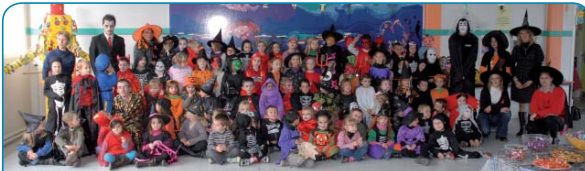
Masques et monstres Halloween