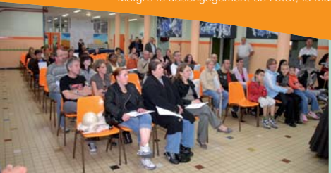
Une assemblée attentive aux informations du séjour ▲