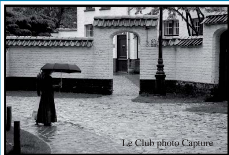
Le Club photo Capture