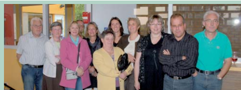
Les nouveaux membres du bureau ▲

Comité des Œuvres Sociales du Personnel de la Mairie