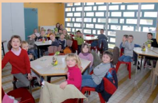
▲ Le loto tout choc