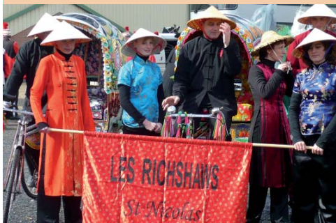
▲ Les Rickshaws au carnaval de Denain

Plus de 120 enfants accompagnés par leurs parents ont été pris en photo lors de cette matinée