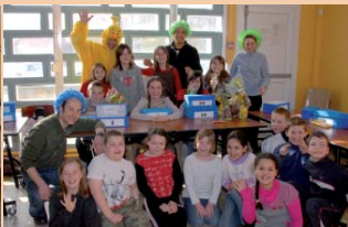
▲ A prendre ou à laisser