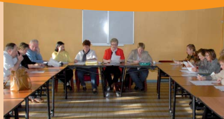
▲ La lecture des bilans moral et financier