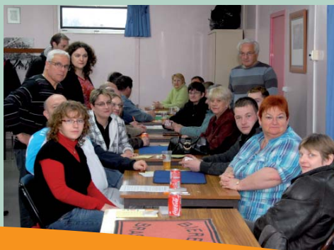
20 équipes ont participé au concours ▼