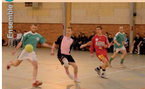
▲ Un tournoi qui s'est déroulé dans la Bonne Humeur